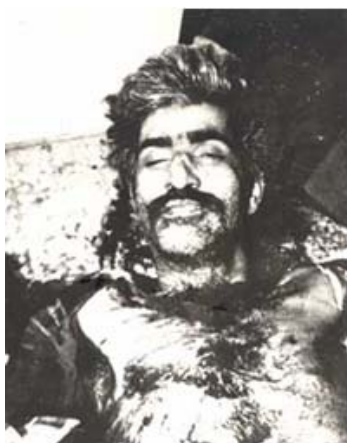
آن شب دلم پرنده سرخی بود که روی آن فلات سوزان می‌گشت

از کتاب: در جدال با خاموشی - تحلیلی از زندانهای جمهوری اسلامی در دهه ۶۰