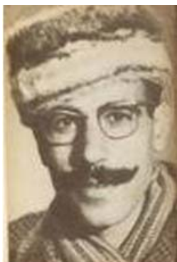
معلم انقلابی صمد بهرنگی

در سال‌های ۶۰ و ۶۱ زندانیان سیاسی انقلابی، در راهروهای زندان‌ها با تن‌های شکنجه شده رها می‌شدند چرا که شکنجه‌گران سرشان بسیار شلوغ بود و فرصت جا به جا کردن زندانیان را نداشتند. زندانیان تازه دستگیر شده، از زیر چشم بند آن‌ها را می‌دیدند و با حیرت پیش خود می‌گفتند: "زنده است یا مرده؟! اما جواب هر چه بود، آن قهرمانان برای حفاظت از زندگی، برای حفظ و تداوم زندگی و سرزندگی، برای آفرینش زندگی‌های شاداب در جامعه، چنان شکنجه‌های وحشیانه‌ای را به جان خریده بودند. آن‌ها "لاله"ها و شقایق‌هائی بودند با داغی در سینه، عاشقانی که "محتبشان بیشتر از همه ما بود". زمستانی سخت آغاز شده بود "و هر چه تخم لاله بود"، می‌خشکاند. "اگر لاله خون خودش را بر زمین نمی‌ریخت، زمین برای همیشه لاله را فراموش می‌کرد، مردم هم دیگر لاله را نمی‌دیدند." بلی، لاله‌های دهه ۶۰