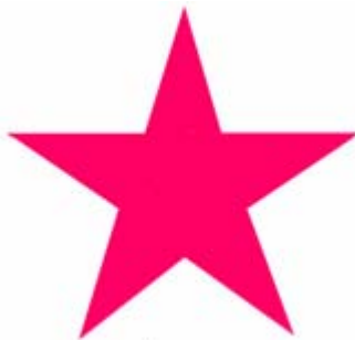
به یاد شهدای گمنام خلق

آری وجود طیفی از افراد در حال حاضر زنده که علیرغم وابستگی‌های سیاسی‌ای که داشتند زندگی‌شان مسیر زندان و شکنجه را طی نکرد، بدون مقاومت آن مبارزین سرافراز در