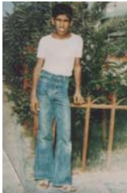
چریک فدائی خلق اسحاق فرامرزی

همچنین در اینجا باید از این واقعیت سخن گفت که در دهه ۵۰، با توجه به کل شرایط مبارزه طبقاتی در جامعه، چنان شرایطی در زندان وجود داشت که نه فقط خیانتکارانی که به خفت همکاری با رژیم تن داده بودند در آنجا کمترین جرأت ابراز وجود نداشتند بلکه کسانی که "عفو" نوشته بودند (یعنی طی یک نامه رسمی ضمن پشت پا زدن به عقاید گذشته خود، از "شاهنشاه" (یعنی دیکتاتور حاکم) تقاضای بخشش کرده بودند) نیز تا آنجا که می‌توانستند این عمل خود را از دیگران مخفی می‌نمودند؛ چرا که سازشکاری و پیمودن راه خیانت مورد سرزنش شدید دیگر زندانیان واقع می‌شد. برای حفظ فضای مبارزاتی و کوتاه کردن دست مسئولین از سیطره شرایط دلخواه خود در زندان‌ها (نظیر آنچه در زندان‌های جمهوری اسلامی با وجود توأبین بوجود آمد)، زندانیان مبارز به شیوه‌های مختلف با چنین کسانی برخورد می‌کردند. قطع رابطه دوستانه با این افراد و بی اعتنائی کردن نسبت به آن‌ها و یا به عبارتی که مطرح می‌شود، "بایکوت" کسانی که خواسته یا ناخواسته سعی در رواج جو تسلیم و تمکین در زندان می‌نمودند، عمده ترین آن روش‌ها بود. (۲) در این میان اگر فردی از میان زندانیان به کار کثیف جاسوسی می‌پرداخت و شناخته می‌شد، زندانیان مبارز در صورت گیر آوردن فرصتی، به بهانه‌ای حتی او را مورد برخورد فیزیکی (کتک) نیز قرار می‌دادند. یک نمونه از این موارد مربوط به زندان عادل آباد شیراز می‌باشد. وقتی روشن شد که یکی از زندانیان با رژیم همکاری کرده و خبرچینی می‌کند و معلوم شد که او باعث لو رفتن یکی از جا سازی‌های زندانیان مبارز شده است، یکی از زندانیان او را به باد کتک گرفت. که این موضوع را همه کسانی که در آن زمان در زندان شیراز بودند، می‌دانند.