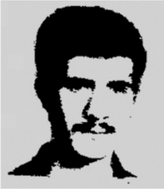
رفیق شهید محمدحسین خادمی