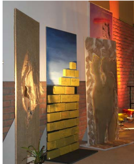
باخته اند افتخار می کنند!

در اتاقی در کنار سالن اصلی سمینار، نمایشگاهی از نام و مشخصات و آثار به جا مانده از ده ها تن از زندانیان سیاسی قهرمانی بر پا شده بود که قلب پرشورشان یا در کشتارهای دهه ۶۰ در سیاهچال ها و یا در کوچه ها و خیابان ها با شلیک گلوله های دژخیمان جمهوری اسلامی از تپش باز مانده بود. عکس هایی از شیر زنان و دلاور مردان کمونیست و مبارز و آزادی خواه؛ کسانی که خون خود را وثیقه پیشبرد مبارزات حق طلبانه کارگران و توده های تحت ستم در راه نیل به آزادی و جامعه ای عاری از ستم و استثمار و نابرابری نمودند. اتاق با این عکس ها و با واپسین نامه ها، آثار و کارهای دستی و هنری آن عزیزان تزیین شده بود. شگفت آن که تمامی این آثار شگرف و خارق العاده در طول روزها، ماه ها و سال ها و به تدریج و اکثراً خارج از چشم و دید زندانبانان و شکنجه گران دژخیم خلق شده بودند. به این اعتبار می شد به راحتی تصور کرد که صرف تلاش برای درست کردن و خلق آنها در آن روزهای سیاه شکنجه و اعدام نشان از روحیه مقاوم و ایمان خلل ناپذیر به آینده از سوی صاحبان دست های خالق این آثار می داد. دستبندی از هسته خرما، سمبل مار سیاهی که دو کبوتر سفید در شکم آن بود، یک کنده کاری طلایی با شعاری موجز اما گویا و کوبان بر آن "ما همانیم که بودیم و همان خواهد بود"، نامه مادر یا پدری که در آستانه اعدام برای کودک دلبندی که او را هرگز ندیده و از احساسات عمیق و عشق بی حد و مرز خود به کودک دلبندهش نوشته بود و آرزوی اینکه ای کاش می شد یک بار و فقط یک بار دیگر پیش از