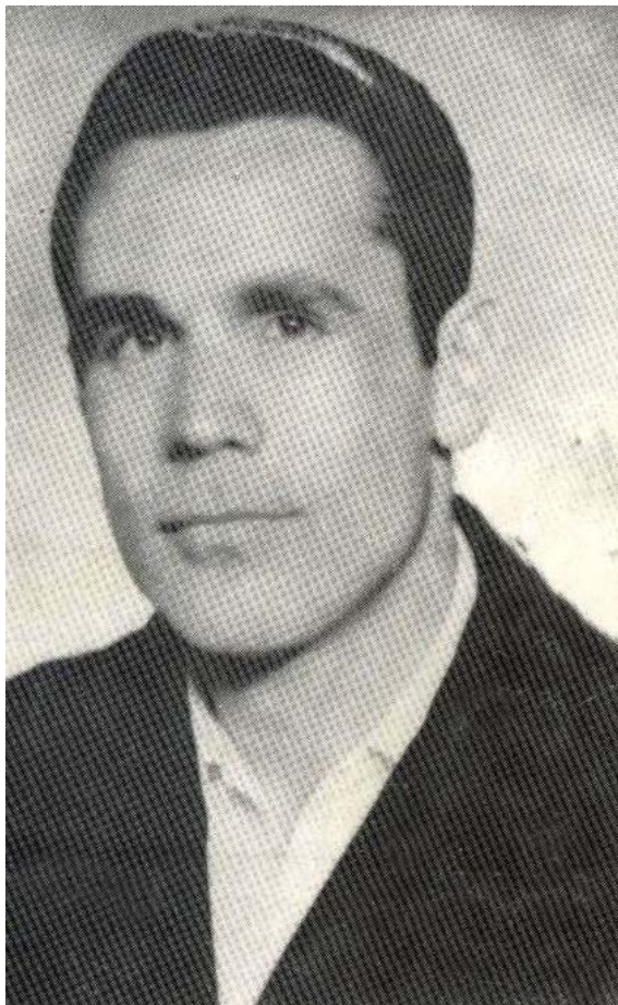
به گرامیداشت رفیق شهید بهروز دهقانی